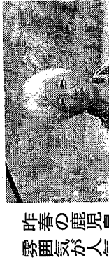
昨春の鹿島野圃が人

生き物ではなかったのだ。味噌汁を作るときに使う、煮干しの尻尾の先っぽ、だった。キッチンでは賞味期限を確かめたり、新しい料理にチャレンジする時にレシピを眺むぐらいしか眼鏡をかけるので、完全な目撃者。勘違い。人生は、大なる動盪の中で生きていて、といったひとがいた。が、人生は、少しの大なる動盪と、多くの些細な動盪で出来上がっているものだ。少なくとも、わたしの場合は。それにしても、正体が判明した途端、アイツが止まっていたところが、わたしの無機質なタイルになってしまった。なんだか淋しい。(作家)