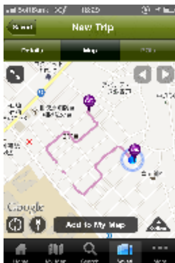
「2.5%」肢体不自由者の数